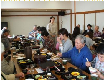
ユニの湯で会食・講演

様には満足していただき、「サケのふるさと水族館」を後にしました。次に国道337号線を通り、道の駅「マオイの丘公園」に11時20分到着。野外に設けられた農産物直売所では、農家で採れた新鮮な農作物が安く販売しており、それぞれに買い物を楽しまれていました。