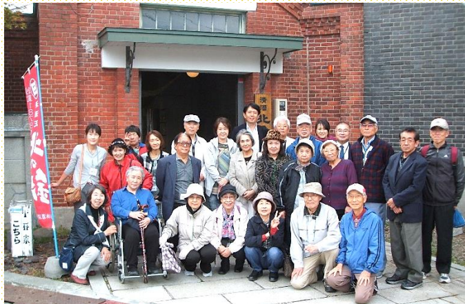
小林酒造にて参加者全員で記念撮影

後、酒の仕込み蔵や創業者の小林家を見学し、試飲コーナーで利き酒にチャレンジしたり、様々な商品のショッピングを楽しまれました。16時10分に小林酒造を離れ17時に出発地の当院へ到着し、解散となりました。総走行距離105キロ、天候に恵まれ参加者からは「楽しい旅行でした」との言葉をいただきました。当院で治療を受けられている参加者がほとんどで、旅行中体調を崩された様子もなく安心しました。これからも会員の皆様を楽しんでいただける旅行を企画していきたいと思っております。